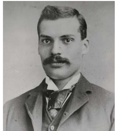
ONDER: J.B.M. Hertzog, wat die Nasionale Party in 1913 in Bloemfontein gestig het. In sy eerste termyn as eerste minister, van 1924 tot 1929, het sy party die grondslag gelê vir die semistaatsektor in Suid-Afrika met die skep van Yskor (vir die vervaardiging van staal) en Eskom (as elektrisiteitsverskaffer). Saam met Jan Smuts, die leier van die Suid-Afrikaanse Party, het Hertzog die Verenigde Party gestig wat in 1936 die wetsontwerp voorgestel het wat swart kiesers in die Kaapprovinsie van die stemreg ontnem het en die reservate se grondgebied verdubbel het.

Onder party van die meer liberale wittes het die geloof bly voortbestaan dat indien die swartes meer grond sou kry, hulle dié beleid sou aanvaar. In 1923 het Selby Msimang van die African National Congress gesê dat swart mense met gebiedsegregasie tevrede sou wees indien die Naturelle Grond Wet die helfte van die grond in die land vir swart besit sou afstaan. Maar teen hierdie tyd het elke wit leier geweet dat om die helfte of selfs 'n